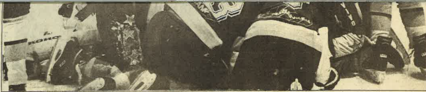
Segern är vår... Jublande hockeykillar i en enda hög på isen. Den här scenen är hämtad från Parcahallen, där HV:s B-pojkar tog hem en ungdomscup. Och gissa om det jublades.