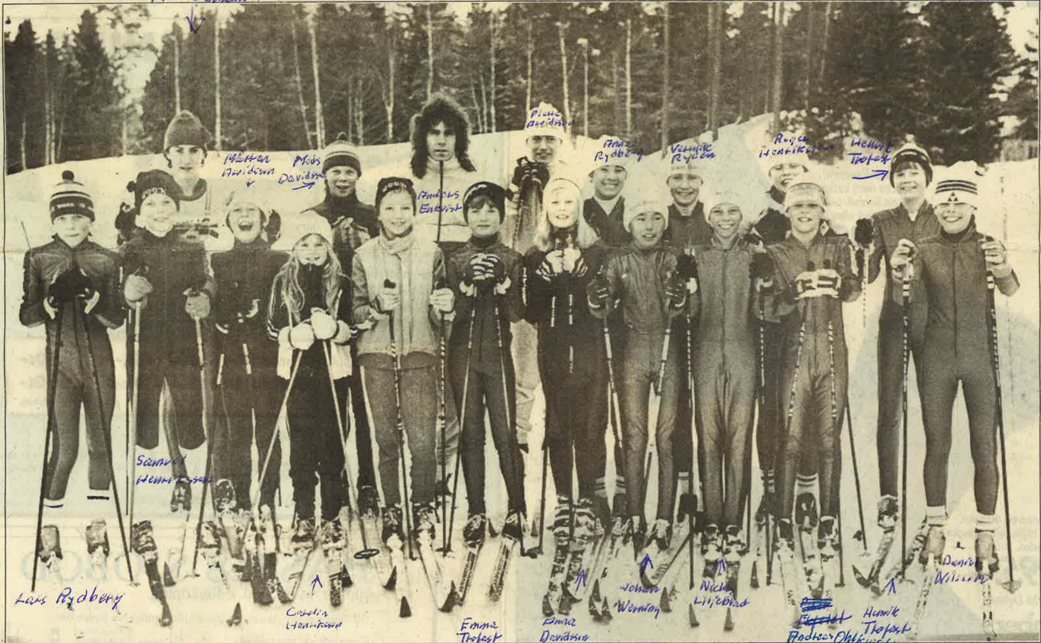
LSSK är en skidklubb med många lovande ungdomar som har framtiden för sig. Här är några av dem.