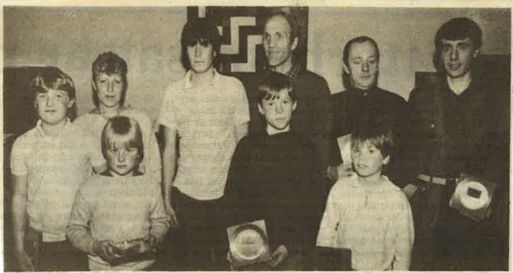
Klubbmästarna i LSSK 1984 ses här i samband med prisutdelningen på Furuvi i lördags.