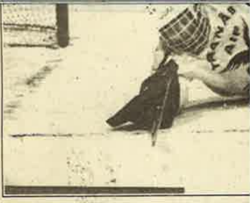
Igenom, ett par snabba skär. snygga fullträffar också när