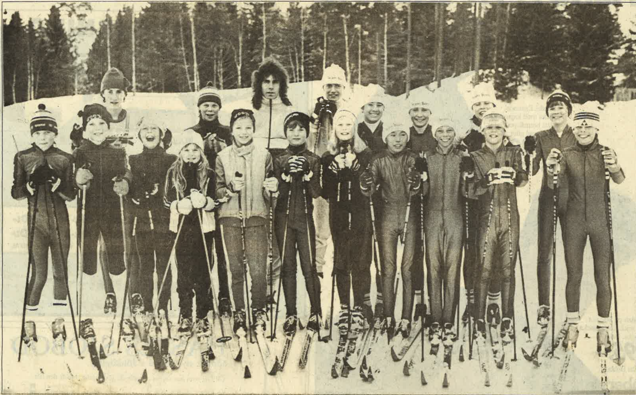
LSSK är en skidklubb med många lovande ungdomar som har framtiden för sig. Här är några av dem.