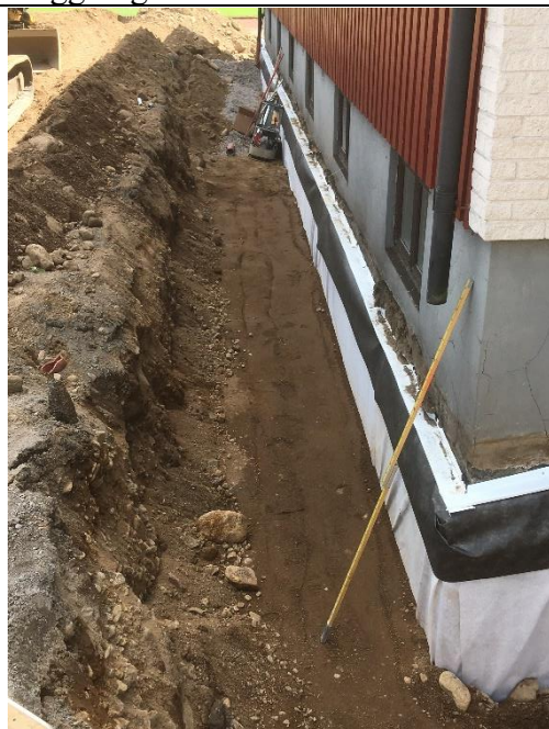
Östra fasaden med färdigställd fukt- och värmeisolerering. Mar uppfylld till hälften.

Bidragsstöd från Kultur & Fritid, Landsbygdsutvecklingsstöd och RF-SISU anläggningsstöd.