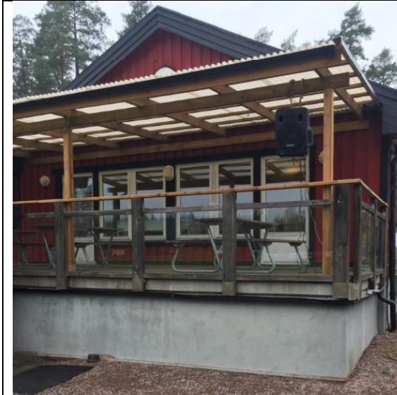
Skärmtak över terrass