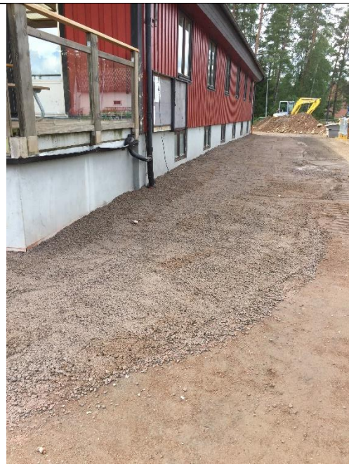
Färdigställt mot öster

2-Projekt-Skärmatak & utvändigt belysning kring klubbstugan.