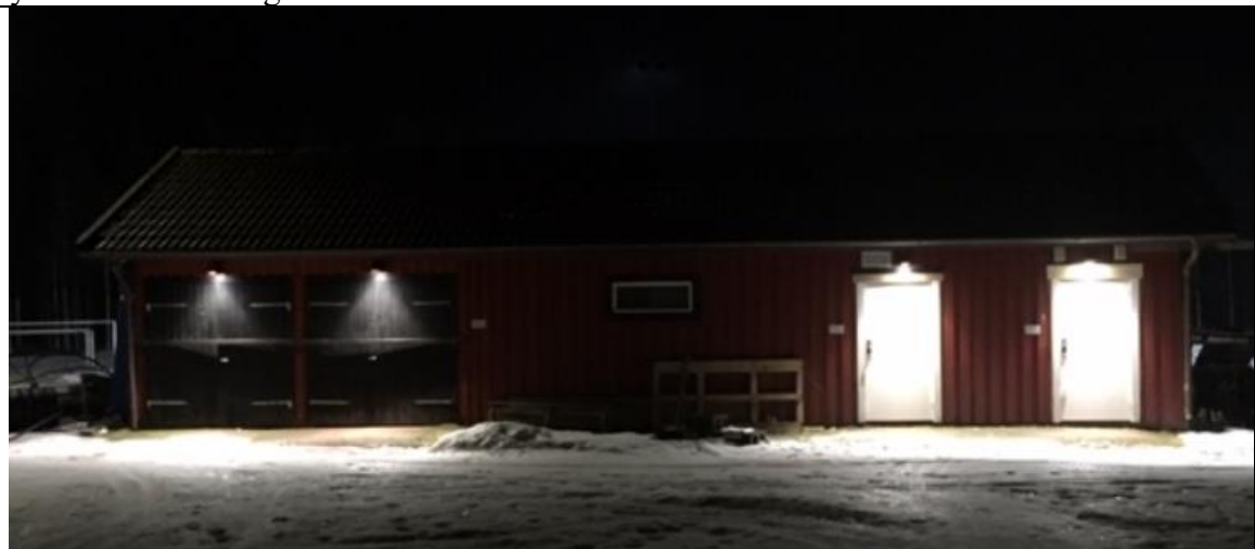
Ny belysning och nya förrådsdörrar till idrottsförråden med kodlås

Utvändig belysning ersatt med LED-belysning och med smart styrning. Förrådsdörrar till idrottsförråden ersatta med nya och trycken med kodlås monterade. Johnny Segerhammar ansvarade för hela projektet genomförande. Sandins El sponsrade med arbete för byte av utvändig belysning. Fredagsgruppen med Bengt Johansson, Magnus Claar för montaget av trycken och kodlås. Tisdagsgruppen med Bernt Trofast och Olle Werning monterade de nya dörrarna. Bidragsstöd från Kultur & Fritid.