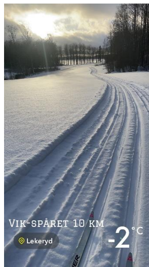
Bild från Vik ner mot Stensjön 19 januari 2024