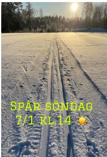
Bild från spår B-plan 7 januari 2024

I Vasaloppsveckan som är målet för långloppsåkarna gjordes i år 10 starter.