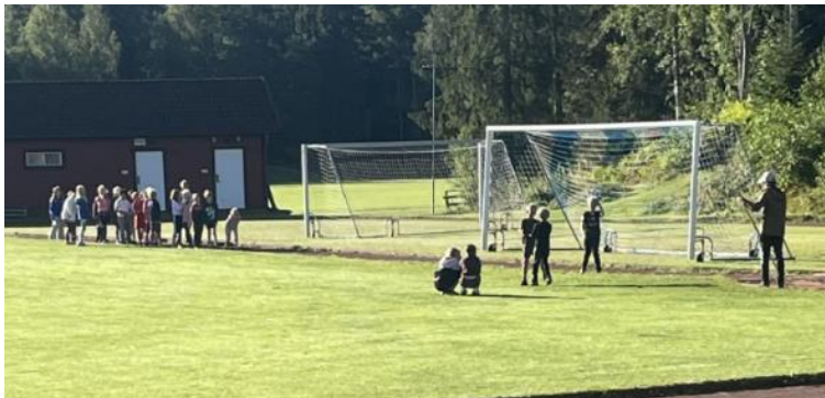
Idrottslektion i september

Ny idrottslärare finns sedan 2024 HT på Lekerydsskolan.